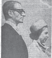
ملکه انگلستان در سیمین ماه مه ۱۹۰۲

ملکه انگلستان در سیمین ماه مه ۱۹۰۲ به تهران آمد. در آن زمان تهران تازه تاسیس شده بود و این اولین سفر رسمی یک ملکه به ایران بود. در آن زمان تهران تازه تاسیس شده بود و این اولین سفر رسمی یک ملکه به ایران بود. در آن زمان تهران تازه تاسیس شده بود و این اولین سفر رسمی یک ملکه به ایران بود.