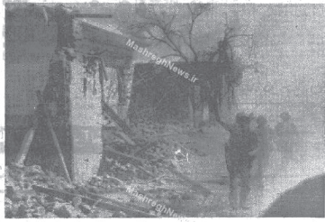
هواپیمای اسرائیلی در حال بمباران شهر حلب در سوریه