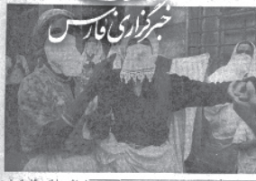
دعوت پادشاه افغانستان از شاهنشاه ایران

بن بلافرزند قهرمان غازی آماده دهبها هزارتن از مردم و سراناز ارتش آزادی بخش: دعوت پادشاه افغانستان از شاهنشاه ایران