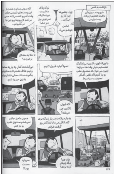
نمونه‌ای از یک صفحه از کتاب