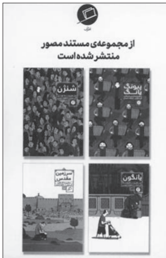
سایر آثار نویسنده

گی دولیل به عنوان یک شهروند اروپایی به ذکر ظلم ها، زشتی ها و نابسامانی های متعددی