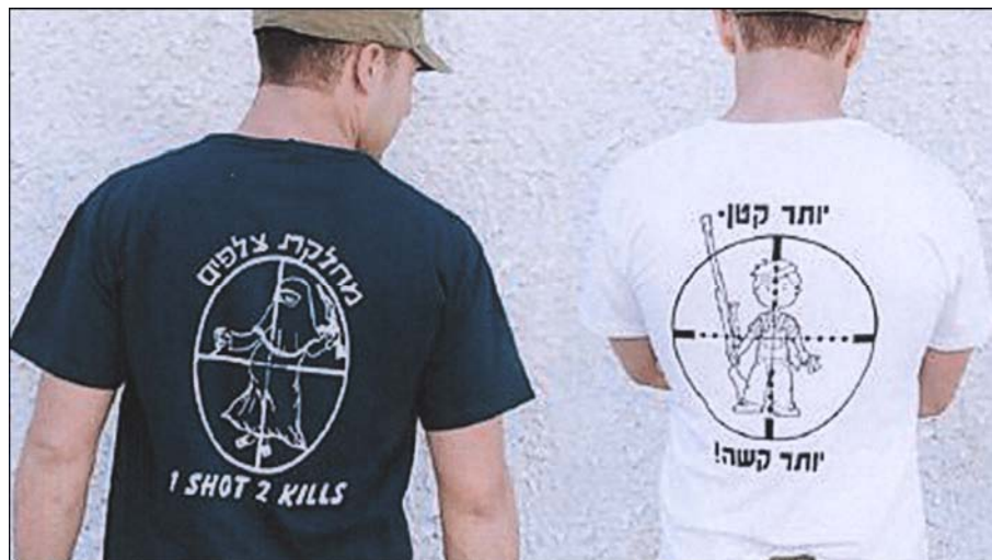
یک گلوله دو کشته:

یهودیان در سر زمینهای اشغالی فلسطین با تبلیغ کشتن زنان مسلمان بار بار به دو هدف می‌رسند.