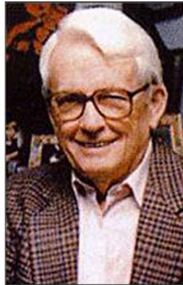
پل فیندلی نویسنده کتاب «فریب‌های عمدی»

رئیس کارکنان کاخ سفید نقش مهمی در نظارت بر عملکرد تیم (کارکنان) کاخ سفید دارد. وی همچنین می‌تواند درباره دستیابی رئیس جمهور به اطلاعات و توصیه‌هایی که برای اتخاذ تصمیمات لازم به آن نیاز دارد، نظر دهد. وی کسی است که درباره برنامه کاری مربوط به فعالیت‌های مختلف رئیس جمهور، نظر می‌دهد. گفتنی است که «رام امانوئل» سومین یهودی