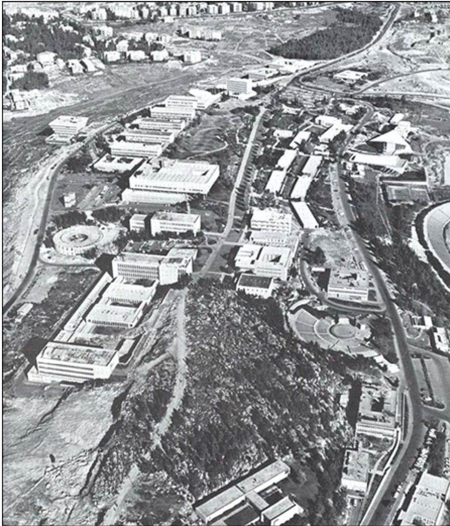
دانشگاه عبری اورشلیم بر فراز کوه اسکوپوس

السامری، کتاب الاکوار و الادوار النورانیة و اقرب الاسانید اشاره کرد.