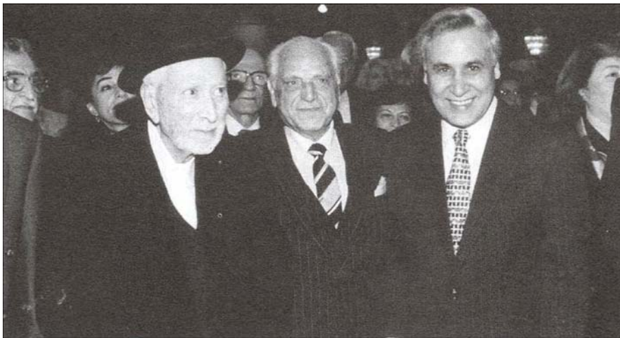
موشه کتساو (رئیس جمهور سابق رژیم صهیونیستی) لطفاله حی و پدیدیا شوفط

اطلاق می‌شود، واقعه‌ای بی‌اساس و کذب محض، تلقی می‌شود. در واقع صهیونیست‌ها با ساختن این داستان، سعی در خلق اسطوره‌ای جدید دارند تا از پس مظلوم‌نمایی حاصل از آن مهاجرتی گسترده به فلسطین اشغالی را سامان دهند و در نتیجه با تمرکز یهود در این منطقه مقدمات دولت صهیونیستی را فراهم نمایند. اگر چه از دستاوردهای ساختن این قصه جعلی به این مقدار نیز اکتفا نکرده‌اند و پس از ۶۰ سال، همچنان از طرق مختلف از آن بهره‌های مختلف می‌برند. ۱