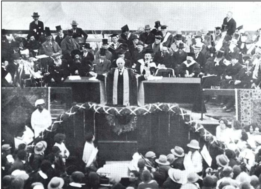
افتتاح رسمی دانشگاه عبری اورشلیم در سال ۱۹۲۵ توسط لرد بالفور و با حضور سرهربرت ساموئل، حییم وایزمن و آبراهام اسحاق کوك

با وجود تداوم جنگ، جدیت وایزمن در انجام طرح خود، سبب شد تا در دوران جنگ جهانی به همراه گروهی عازم فلسطین شود که اقدامات اولیه را برای تأسیس دانشگاه انجام دادند. سفر وایزمن بعد از اعلام اعلامیه مشهور بالفور صورت گرفت. در ۲۴ جولای ۱۹۱۸ در اقدامی نمادین دوازده سنگ دانشگاه در دامنه کوه اسکوپوس، منطقه‌ای قدیمی در شمال شهر بیت‌المقدس، به عنوان سنگ بنای اولیه دانشگاه نهاده شد. زمین این دانشگاه که پیش از جنگ توسط اسحاق گولدبرگ از حقوقدانی انگلیسی به نام سر جان گری هیل خریداری شده بود، یکی از مناطق زیبای شهر بیت‌المقدس بود.