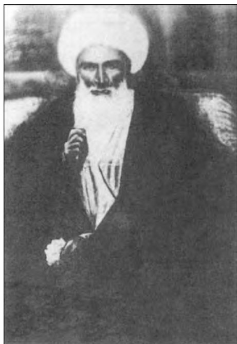
آیت‌الله حاج ملاعلی کنی

در حرکت‌ها و نهضت‌هایی که در درازای سده گذشته تا انقلاب اسلامی پدید آمد،