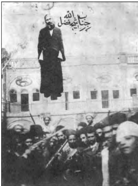
شهید آیت‌الله حاج شیخ فضل‌الله نوری بر چوبه دار

یکی از تفاوت‌های قیام ۱۵ خرداد با نهضت‌های سده گذشته رشد سیاسی و بینش والای حماسه‌آفرینان خرداد خونین است. در برخی از حرکت‌ها و نهضت‌های پیشین می‌بینیم که عوامل و ایادی استعمار توانستند مردم را فریب دهند و با شگردها و شیطنت‌هایی آنان را به درون سفارت دشمن آزادی و استقلال ملت ایران بکشانند و با جوسازی‌ها و هوچی‌گری‌ها،