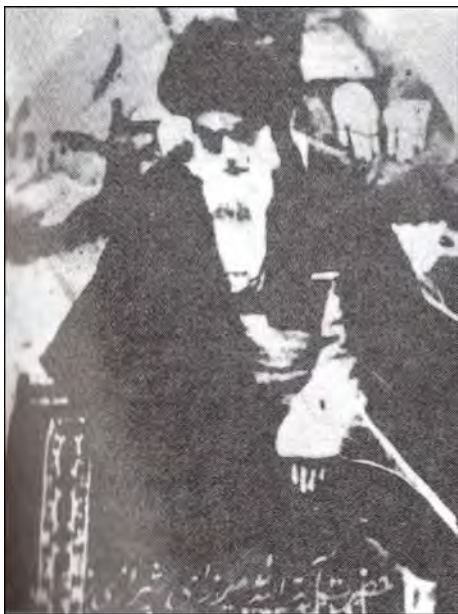
آیت‌الله میرزا محمدحسین شیرازی

ایران در پشت پرده به بند و بست با آن کفتار پیر نشست و با باز گذاشتن دست آن در همه شئون سیاسی، اقتصادی و فرهنگی در ایران و با پرداخت خسارت‌های رژی از خزانه دولت، از زوال قدرت امپراتوری انگلستان در ایران پیشگیری کرد. آن روز که ملت ایران برای استواری عدالت اسلامی به رویارویی با هیئت حاکمه مستبد و زورمدار ایران برخاست و لرزه بر اندام کاخ‌نشینان انداخت، استعمار انگلیس که نقش شریک دزد و رفیق قافله را بازی می‌کرد، توانست با نیرنگ‌بازی و فریبکاری نهضت ملت ایران را به بیراهه