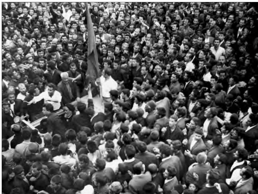
امام در حال رفتن به فیضیه برای ایراد سخنرانی تاریخی ۱۳ خرداد ۴۲

صبح فردا مأموران درب خانه‌ی خمینی را به صدا در می‌آورند. می‌خواهند به زور وارد خانه شوند. پسر ایشان جلو ورود آنان را می‌گیرد. مأموران شاه او را به قتل می‌رسانند و خمینی را بدون هیچ مجوز اداری دستگیر می‌کنند. خمینی ساعت ۴ دستگیر می‌شود و در ساعت ۶/۵ تظاهرات کنندگان در تهران و تبریز، شیراز و مشهد به راه می‌افتند.