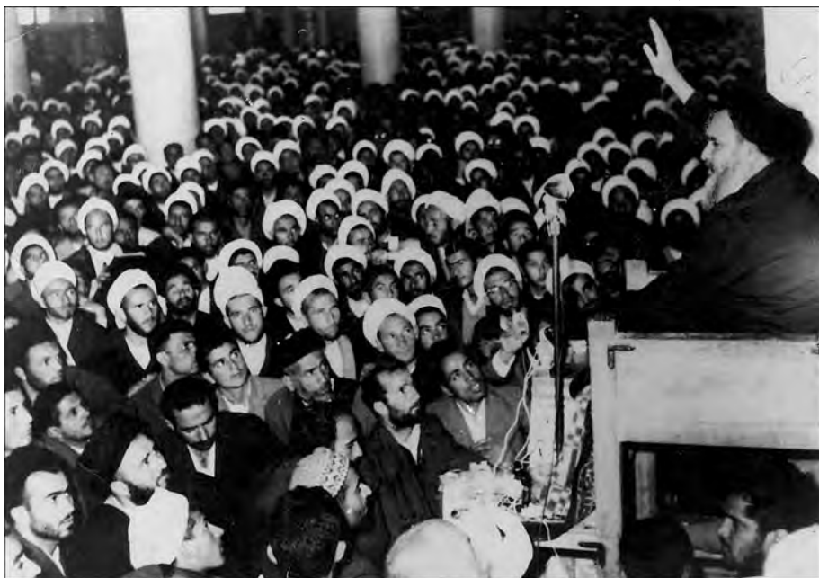
امام در هنگام سخنرانی در مسجد اعظم قم پس از آزادی از زندان (۲۶ فروردین ۴۳)