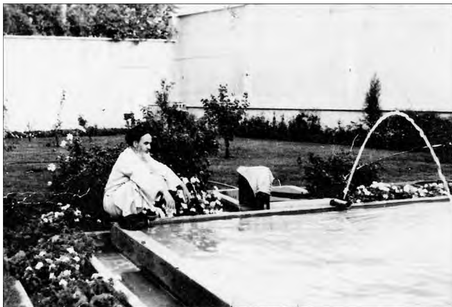
امام در دوران محاصره در قیصریه جنوبی مرداد ۱۳۴۲

درباره‌ی غیر نظامی روح الله الموسوی خمینی که به اتهام اقدام بر ضد امنیت داخلی کشور در تاریخ ۴۲/۳/۱۵ در آن پادگان بازداشت گردیده قرار بازداشت موقت به علت بیم تبانی و اهمیت بزه که به رؤیت نامبرده رسیده است صادر گردید. دستور فرمایید برابر مقررات مشارک‌الیه را بازداشت و نتیجه را اعلام دارند.