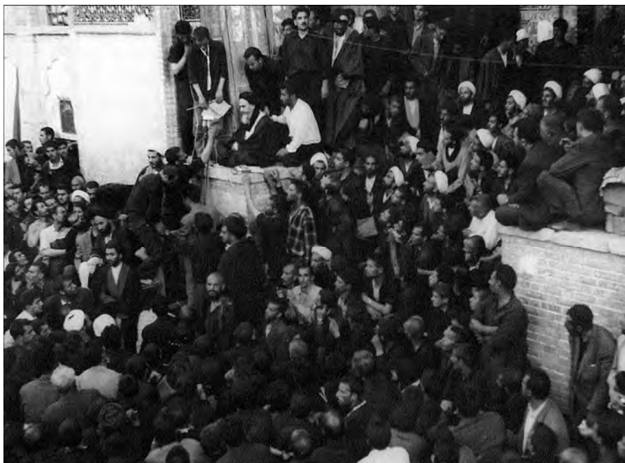
امام هنگام نطق آتشین در مدرسه‌ی فیضیه، عصر عاشورای ۱۳۸۳ (۱۳ خرداد ۴۲)

شکاف بین رژیم سلطه و توده روز به روز عمیق‌تر می‌شود. ملاحی بزرگ در زندان به سر می‌برند و طرفداری توده با آنهاست. جبهه‌ی ملی و مخالفین چپ که خود را از حوادث کنار نگه داشته‌اند، برنامه‌ی معین ندارند و به نظر می‌رسد بیشتر از گذشته ایزوله شده باشند. دانشجویان دست به یک حرکت انقلابی زده‌اند ولی مخالفت آنها تاکنون از محدوده‌ی دانشگاه تجاوز نمی‌کند. کارگران در تهران به شدت و گرمی استقامت می‌ورزند ولی سازمان مرتبی ندارند. ۱