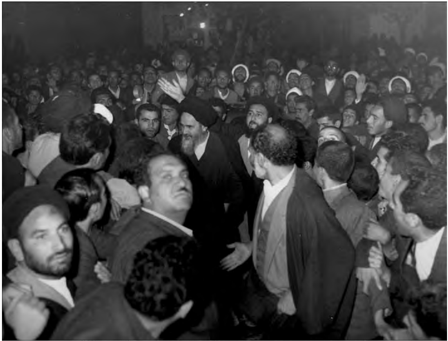
امام در جشن مدرسه‌ی فیضیه (به مناسبت آزادی امام از زندان ۲۰ فروردین ۴۳)

دادند. هر تحلیل‌گری با دیدن این حرکت‌ها تصور خواهد کرد که حرکت مردم، یک حرکت سازمان‌یافته‌ی آهنین و از پیش برنامه‌ریزی شده با رهبری مقتدری است که در قلب حرکت، حضور فیزیکی داشته و از نزدیک، وقایع و رخدادها و نحوه‌ی عمل مردم را هدایت می‌کند، اما آنهایی که در دل نهضت بودند می‌دانستند که این رابطه و سازماندهی‌های مربوط به آن مبتنی بر حضور فیزیکی رهبری در میان مردم نیست، یک پیوند قلبی مبتنی بر اعتقادات و آرمان‌هاست که فقط شاخصه‌ی مرجعیت شیعه و در رأس آن رهبر فرهمندی چون امام خمینی است.