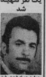
عبدالله محمدی، شهید جوان اصفهانی.

اصفهان - در جریان تظاهرات مردمی در اصفهان یک نفر شهید شد.