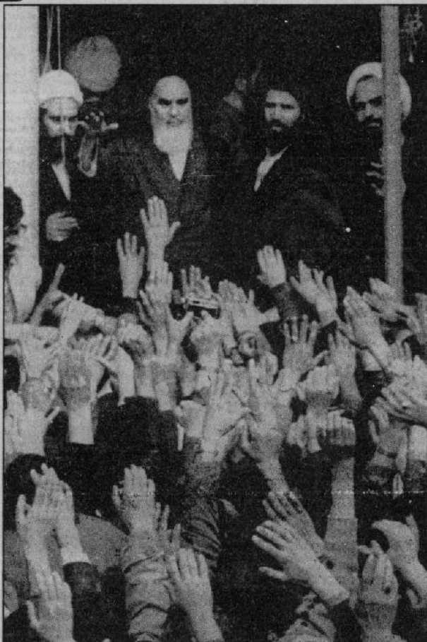
این فرهاد هزاران هزار مرد خمینی است که چون شمشیر فرو بردند و بر نوزده صد تنی که در آن روز با رهبرشان بودند اقبال در سر چرخه که در هنگام خون و شهادت، تلوی یافته است.