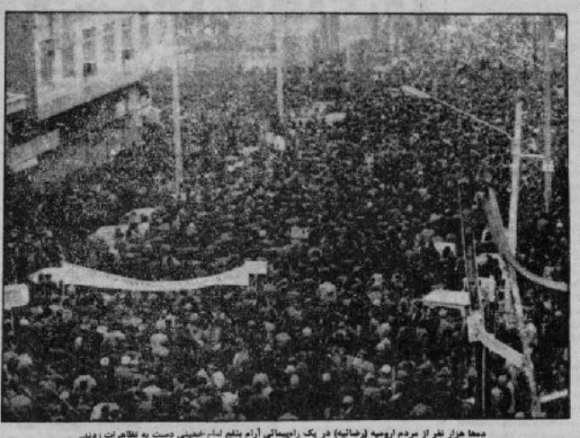
مها هز از نظر از مردم ارومیه (رفاتیبه) در یک راهپیمایی آرام بلیغ اعلام خمینی دست به یادداشت کردند.