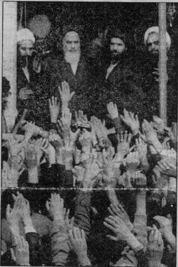
ما همه سرباز توئیم ای امام... این فریاد هزاران مردم است که چون شمل پرخوش تا محل اقامت امام خمینی برافزاده بود.

اقلیت‌های مذهبی در سرنوشت اقلیت‌های مذهبی که همیشه استیفا از این مجازات بوده‌اند، در جمهوری اسلامی چه خواهد شد؟ حضور امام خمینی در دیدار با نمایندگان اقلیت‌های مذهبی در تهران، ۱۳۵۷