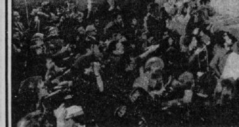
امام خمینی در مصاحبه مطبوعاتی صبح امروز به پرسش دهها خبرنگار پاسخ داد.

دولت ها حق هیچ نظارتی بر رادیو، تلویزیون و مطبوعات ندارند.