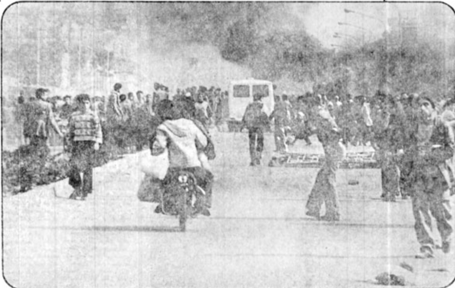
پشت جبهه: در جلو، رزمندگان سنگر به سنگر جلو میروند، و در پشت خط جبهه مردم سرگرم دور کردن مجروحین در صحنه پیکار و رساندن کمکهای اولیه هستند