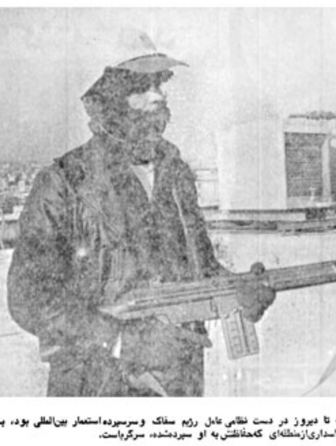
یک روزنامه، با فلک زده که تا دیروز در دست نظامی عامل رژیم سفاک و سرسپرده استعمار بین المللی بود، بسته پاداری از منظره ای که حفاظت از او سیرده شده، سرنگریاست.

تبریک فضا لحق به بازرگان در حالی که بیچاره است. امام در حالی که بیچاره است. امام در حالی که بیچاره است.