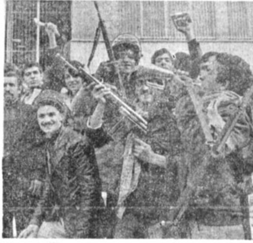
وقهرمانانہ به پیروزی رسیدند...