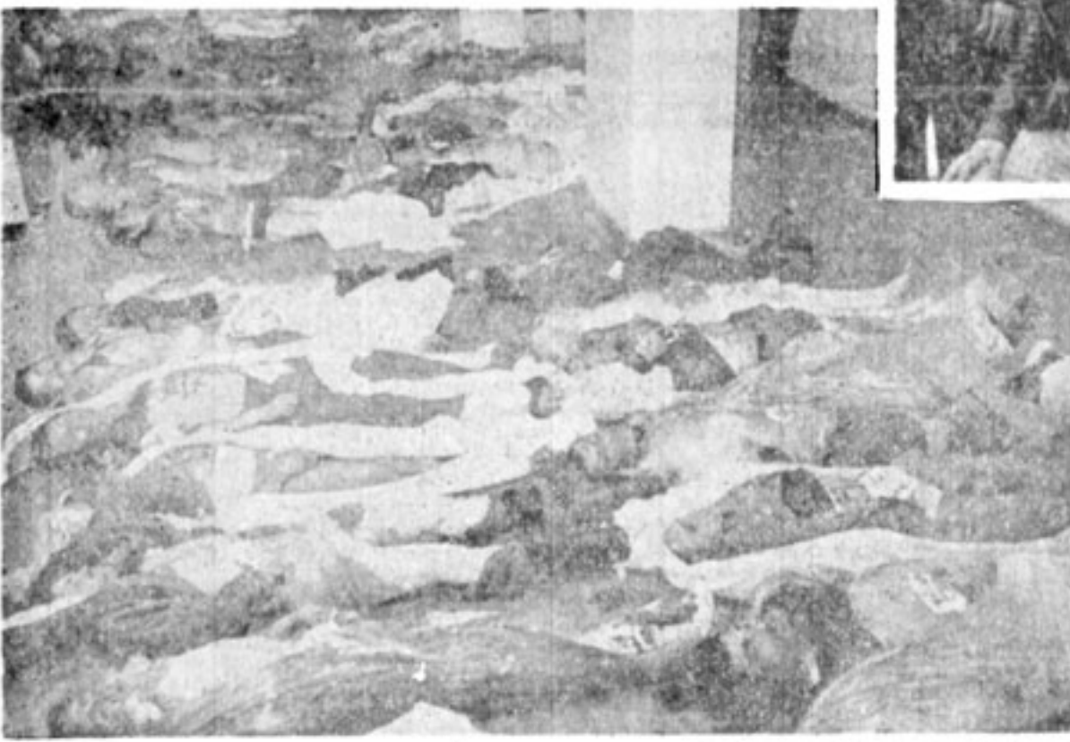
... قهرمانانہ شہید شدند...

پروزی غور رانگیز ملت ایران، برای ازگو نساکن رژیم استبداد برهبری زیم عابقر حضرت آیت الله العظمی خمینی به عموم ملت ایران نهیت گنه و انتخاب مهندس مهدی بازرگان راجل سیاسی و انقلابی را بیست نخستوزیری موقت صمصانہ تبریک می گوئیم . کارگران - کارمندان - مدیران شرکت کارخانجات پارس الکتریک