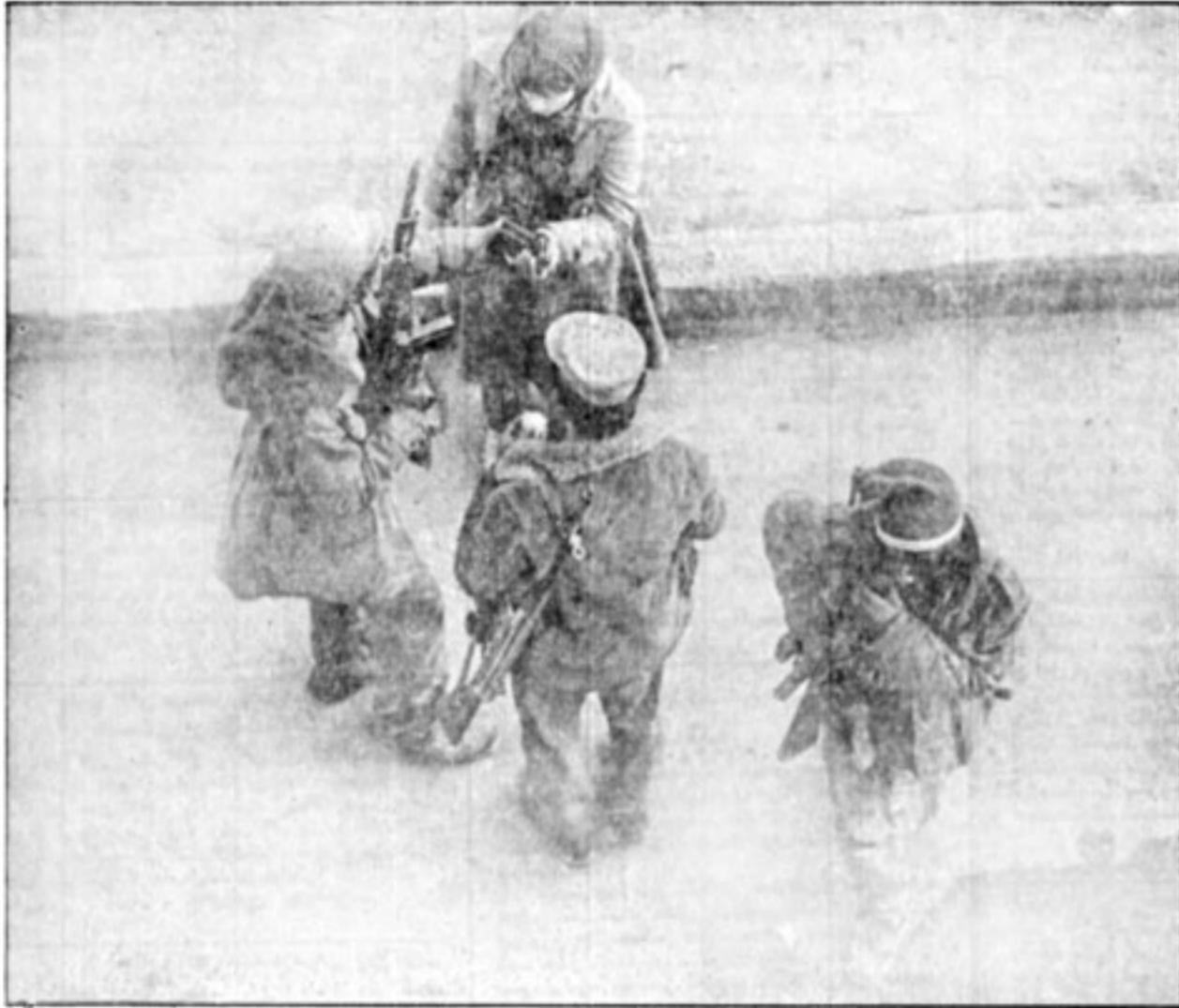
توزیع مهمات و مهمات بین ارتش مردمی حیرت انگیز بود. زنان نیز در پیکار شرکت داشتند و کمترین کارشان این بود که مهمات را بوقوع به رزمندگان برسانند.