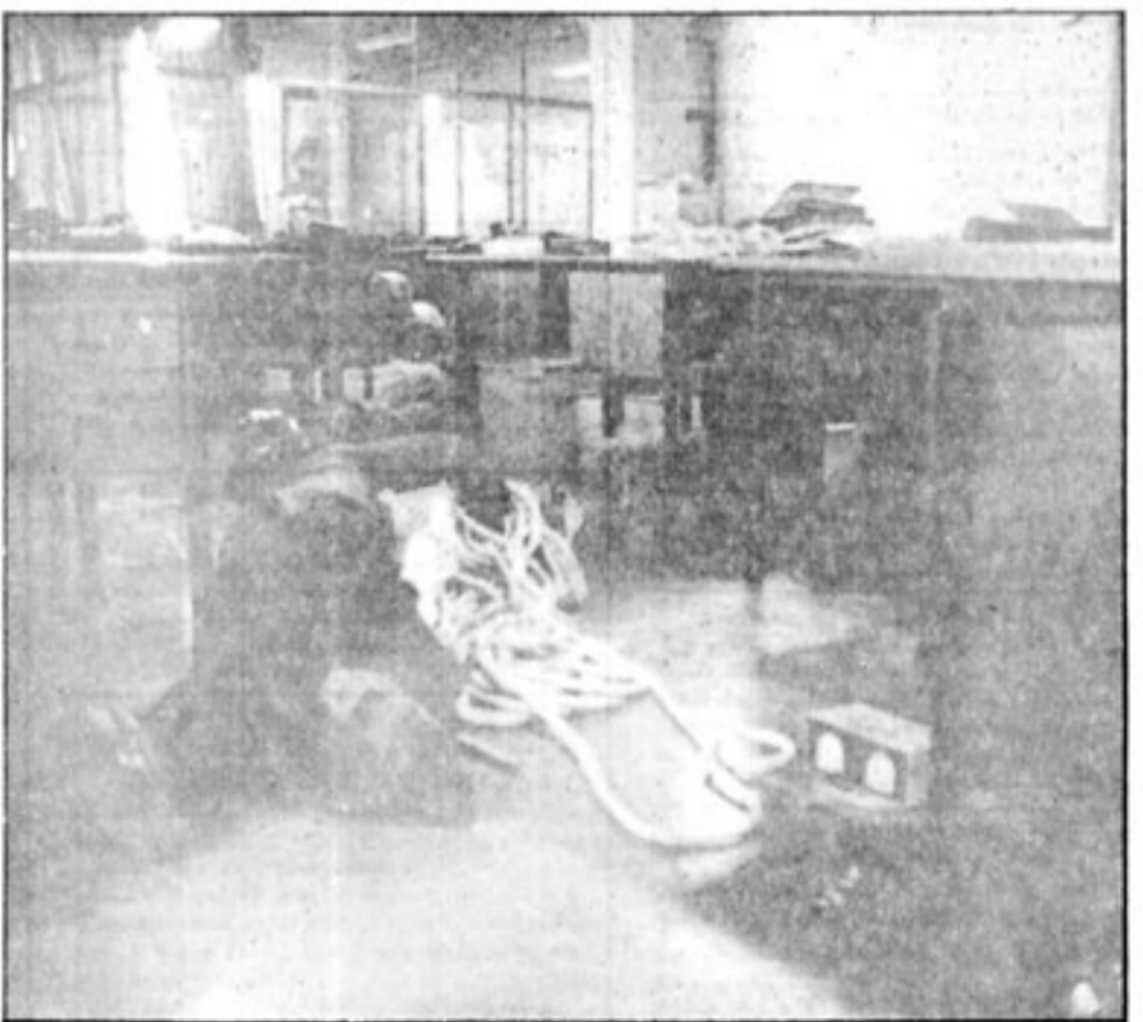
از هر طرف محاصره شد پس از استقرار چریکها

شهادت در افروخت برادر نبرد همه جانبه برای تصرف شگنجه گاه قریب سه ساعت ادامه داشت. نزدیکی های ساعت سه بعد از ظهر، پیکار به اوج خود رسیده بود در این وقت تعداد چریکها به شش نفر رسید بود یکی از خبرنگاران ما که قدم به قدم در پی چریکها بود می گفت: چند دقیقه از ساعت سه