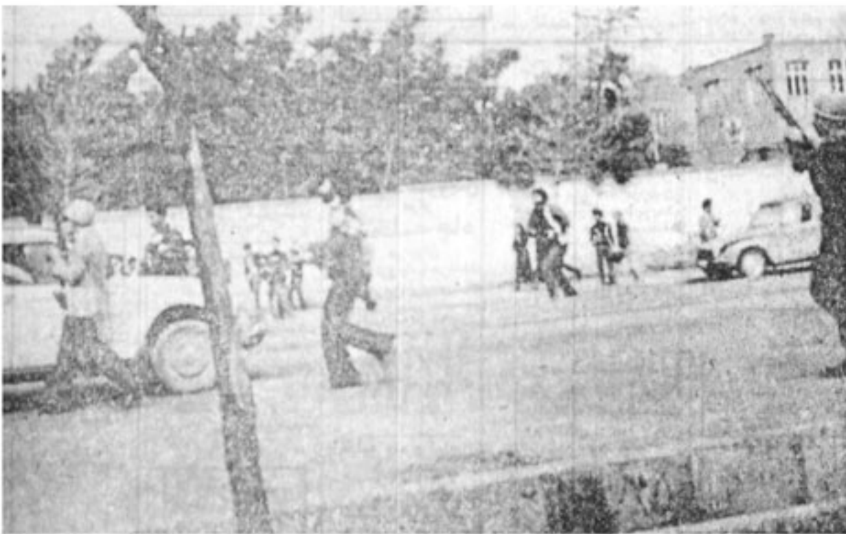
افراد مرکز آموزش های هوایی در خیابان تهران نو نزدیک پادگان با اسلحه مراقب هستند عکس ساعت یازده صبح امروز برداشته شده است.