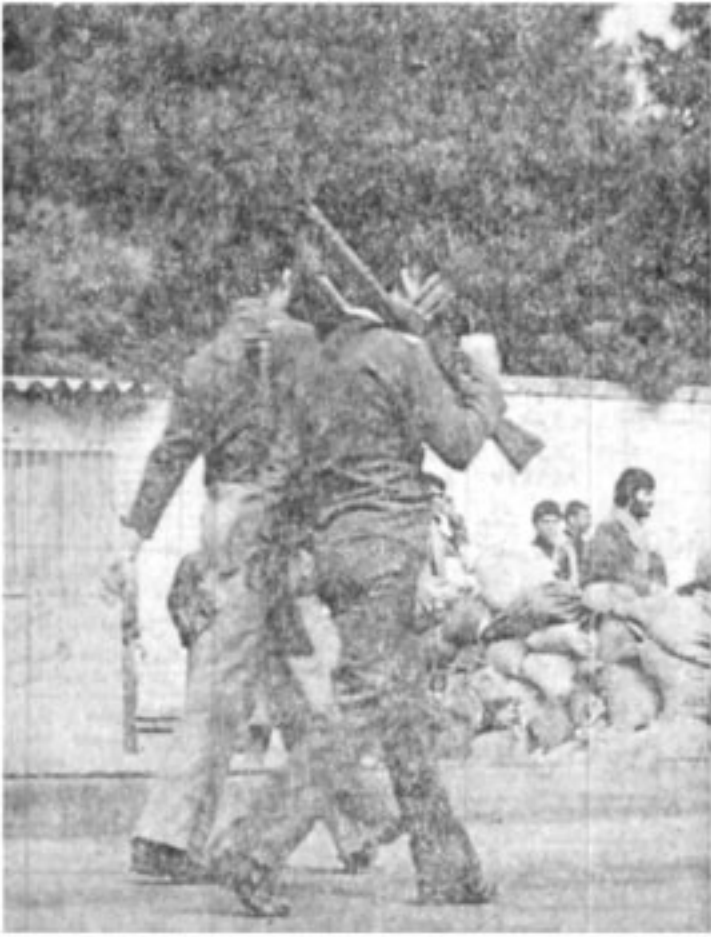
دو تن از افراد هوایی که مسلح هستند پس از عقب نشینی گارد در کنار سنگرها به حفاظت از خیابان مشغول هستند ←