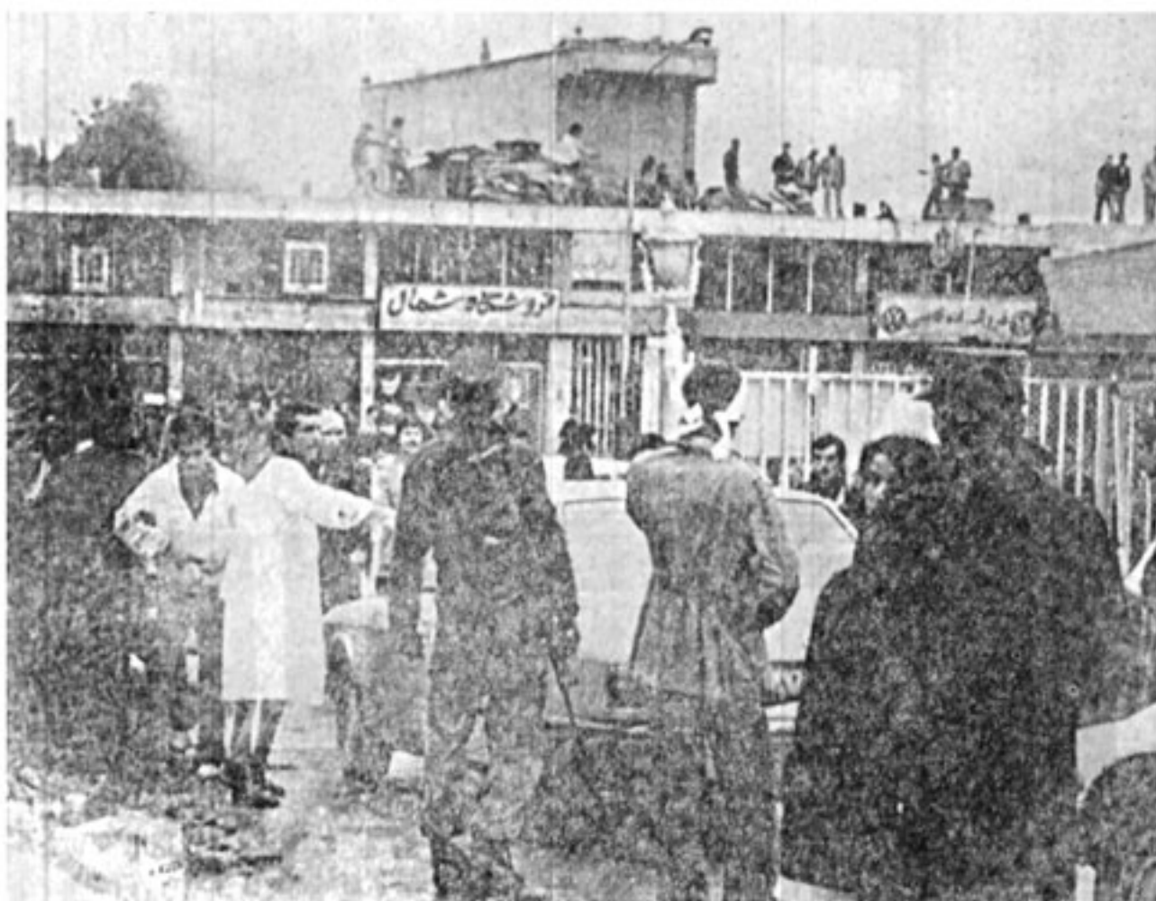
ساعت ۴/۳۰ صبح امروز یک تانک به بیمارستان جرجانی حمله کرد و تعدادی آمبولانس و اتومبیل را از بین برد. بلافاصله مردم تانک را مورد تعقیب قرار دادند و در فاصله ۵۰ متری بیمارستان بان دست یافتند. تانک بتصرف مردم درآمد و سر نشین آن کشته شد. در عکس بالا صحنه ای از وضع بیمارستان دیده میشود. در ساختمان مقابل بیمارستان مردم کسبه های شن و ماسه را به پشت بام ها برده و سنگر بندی کرده اند.