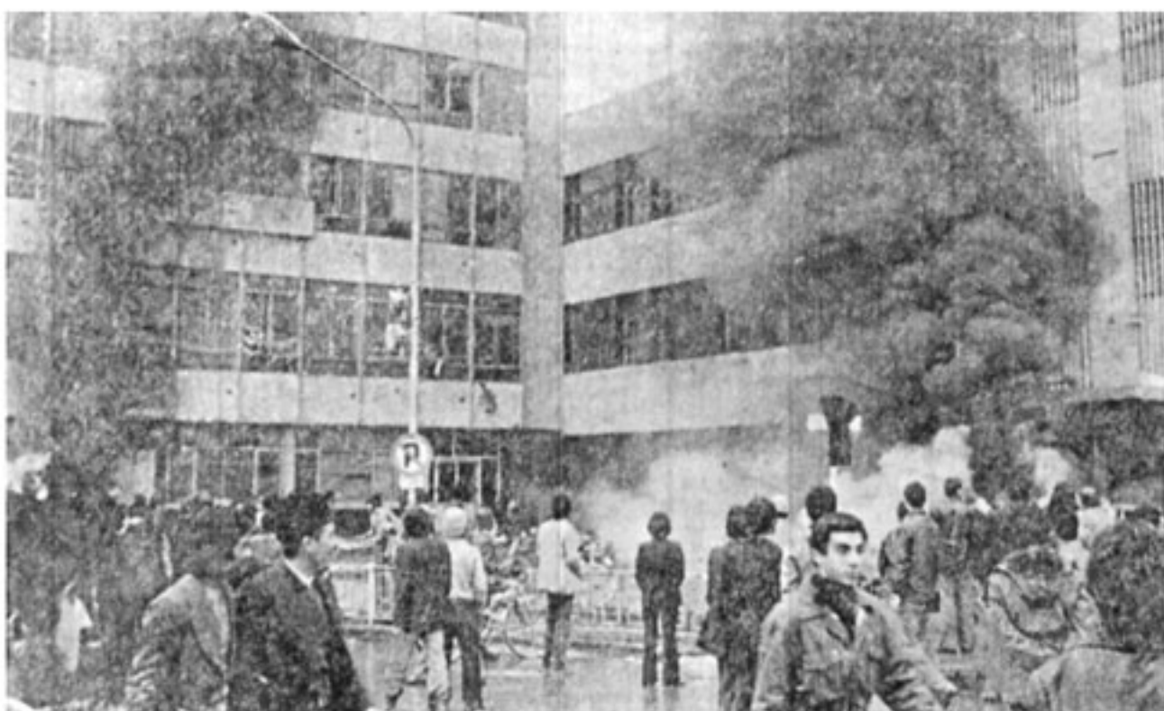
ساعت ۹ صبح یکشنبه ۲۲ بهمن ۵۷ میدان سیه قرارگاه پلیس تهران و راهنمائی و رانندگی قرارگاه ساعت ۵ صبح تخلیه شد. مردم در مقابل قرارگاه اتومبیل های پلیس را به آتش کشیده اند