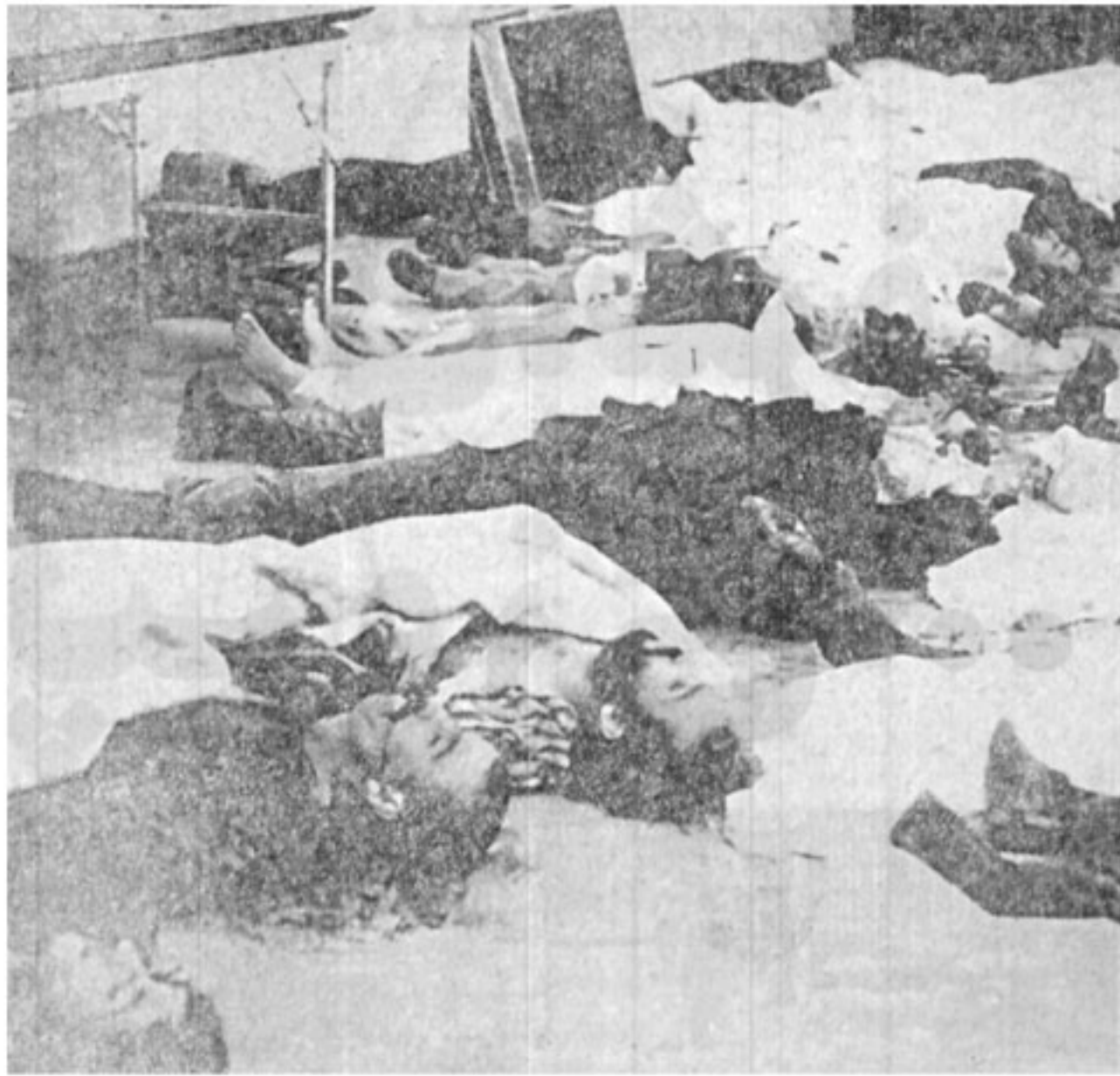
صف‌هایی از جنازه... همه جوان، از نیروی هوایی، از مردم عادی کوچه و خیابان که نمیخواستند و طغیان جوانان بیگانگان باشد. مردمی که برای آزاد کردن از نثار جان خود دریغ نکردند. این منظره فقط مربوط به یکی از بیمارستانهاست. عده شهدا و کشته شدگان را هنوز نمی‌توان بطور دقیق اعلام کرد