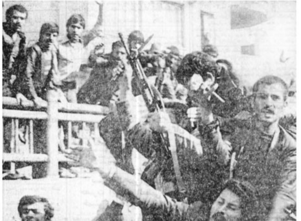
افراد هوایی در لحظاتی که درگیری اوج گرفته، علاوه بر اینکه خود با گارد بهبه درگیر شدند، با شلیک سلاحه خانه، تعدادی سلاحه نیز در اختیار مردم گذاشتند عکس گروهی از مردم را نشان میدهد.