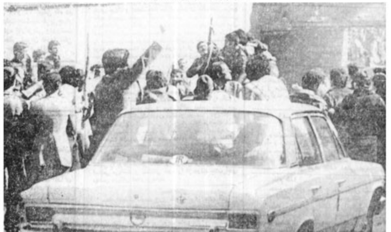
میدان فوزیه - در راهروی اتوبوس روز، مردم برای کمک به همافران و پرسنل هوایی با چوب و اسلحه سرد مجهز شده‌اند یکی دو تن از پرسنل هوایی نیز که اسلحه دارند در عکس دیده میشوند