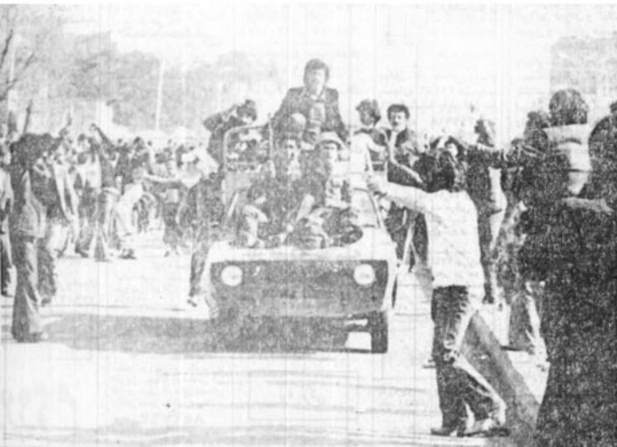
مردم برای افراد هوایی در جاده تهران نو ابزار احساسات می‌کنند و مقاومت آنها را در برابر گارد می‌ستایند عکس در خیابان تهران نو نزدیک پادگان - نیروی هوایی گرفته شده است.