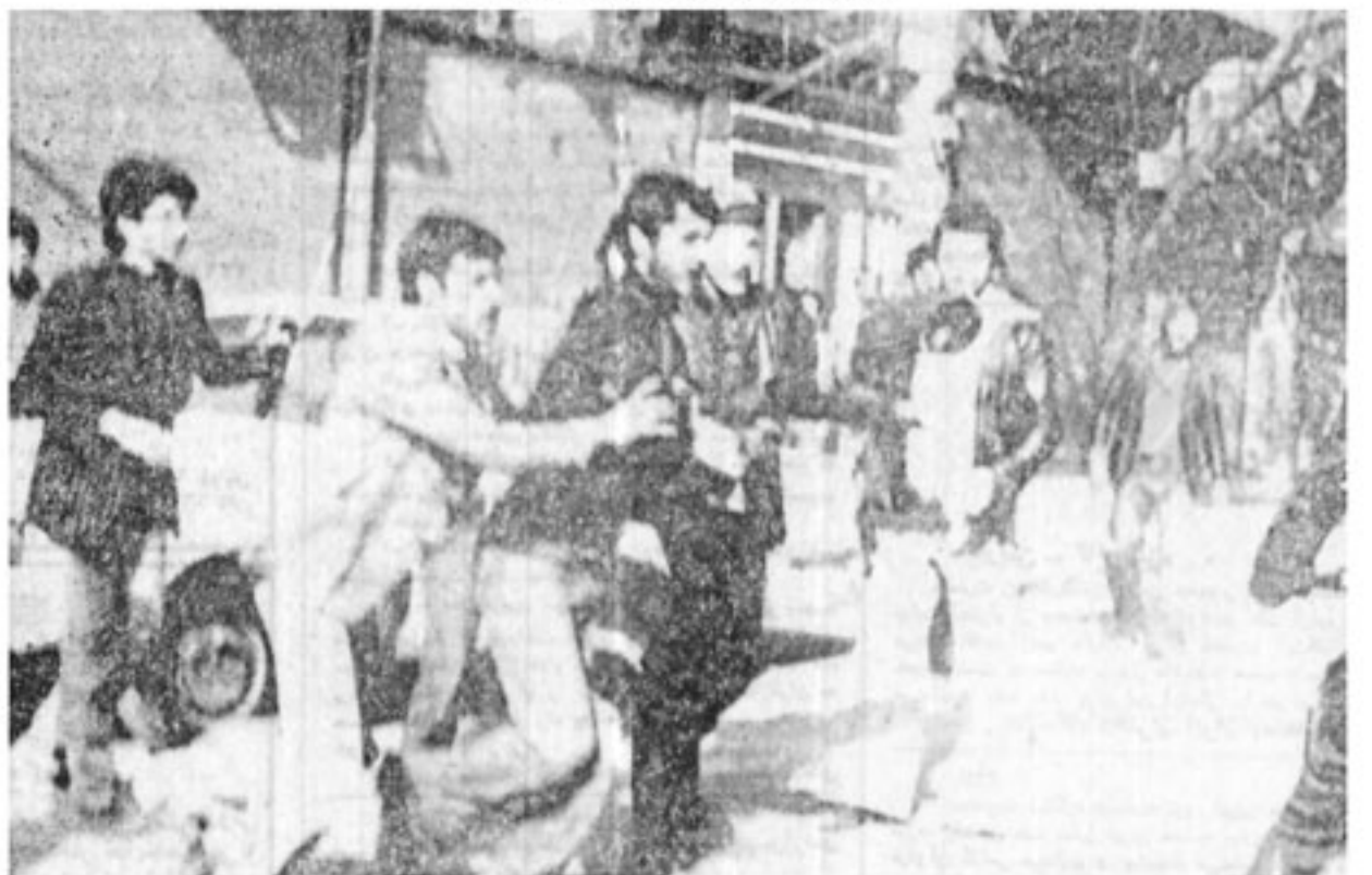
مردم برای دادن خون دعوت میشوند مجروحین آنچنان زیاد است که مسلمانا ذخیره‌های خون بیمارستانها نیز کفاف نمیدهد. از این رو جمعی با شنگر مردم را به دادن خون دعوت می‌کنند