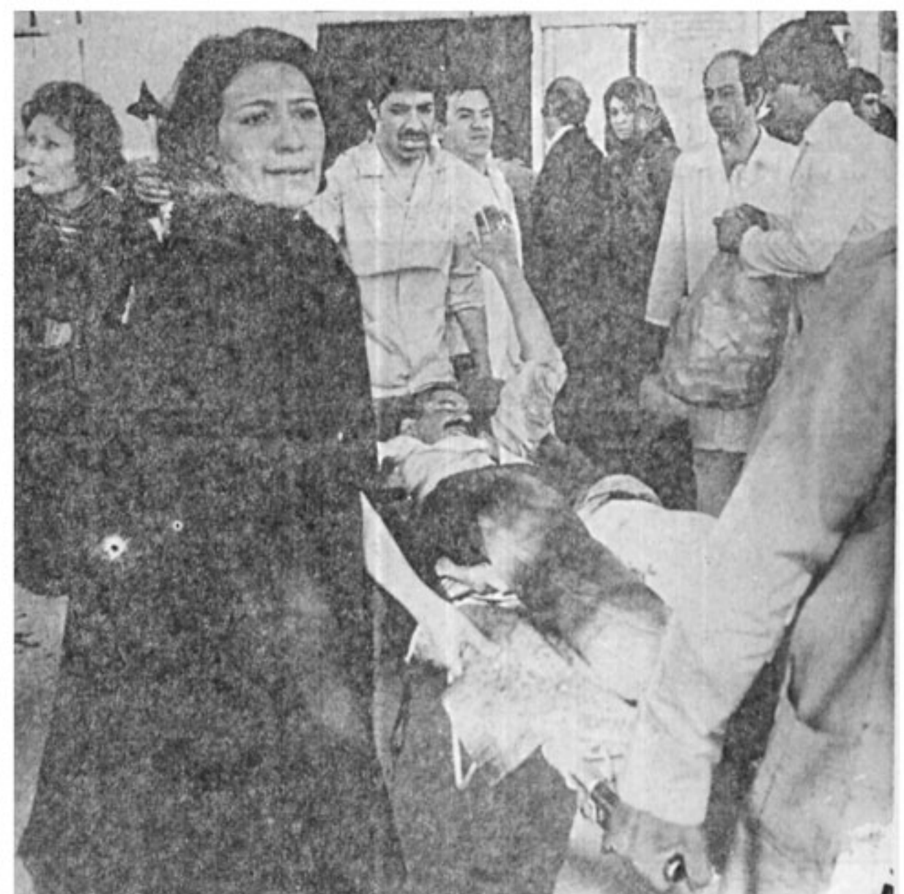
یک مجروح که در جنگ در روز مورد اصابت گلوله قرار گرفته است بداخل بیمارستان منتقل میشود. در همان حال کارکنان بیمارستان لوازم و داروهای را که توسط مردم تحویل آنها شده بداخل میبرند. آندوه و نگرانی مردم از وضع مجروحین، در چهره ها دیده میشود