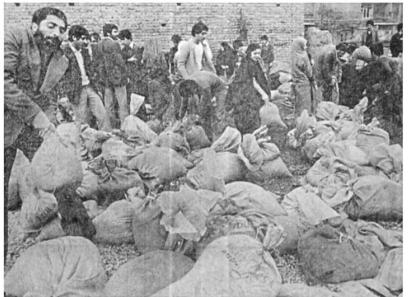
ساعت ۳ بعد از ظهر شب ۲۱ بهمن تمام خیابان های تهران - شن بیاورید، سنگر بسازید. این ندائی بود که بلافاصله پس از اعلام حکومت نظامی در تهران بگوش همه رسید، بفاصله یکساعت زن و مرد با بیل و کلنگ از زمین های بایر اطراف خانه های خود میلیونها تن شن و ماسه و خاک فراهم کردند و در کسبه ها ریختند و آنگاه در خیابانها سنگر برپا کردند.