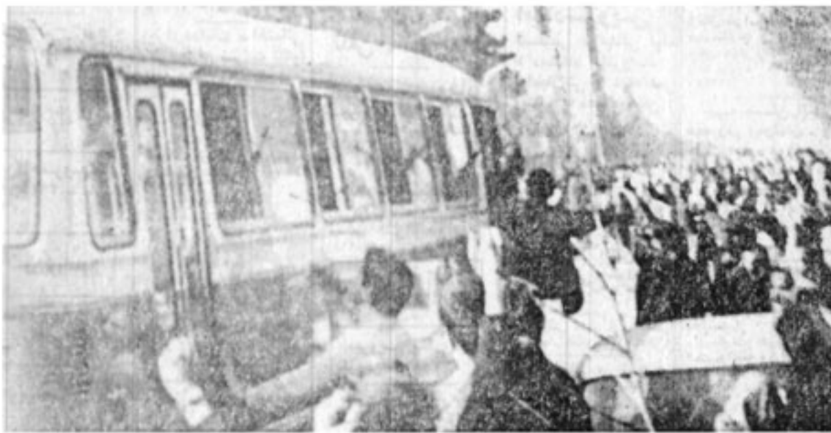
مردم برای پرسنل هوایی ابزار احساسات میکنند. لوله‌های اسلحه افراد هوایی از پنجره اتوبوس حامل پرسنل دیده میشود