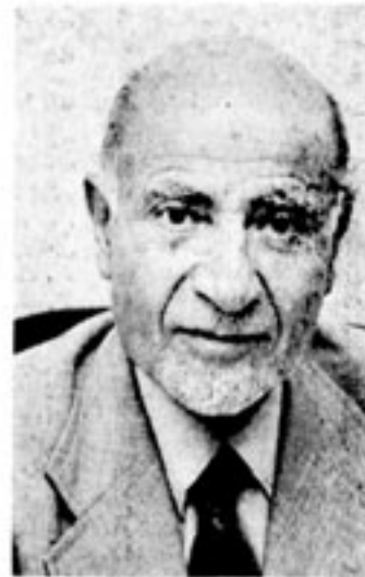
مهندس مهدی بازرگان

عصر امروز امام خمینی در مصاحبه خود مطالب اساسی را عنوان خواهند کرد