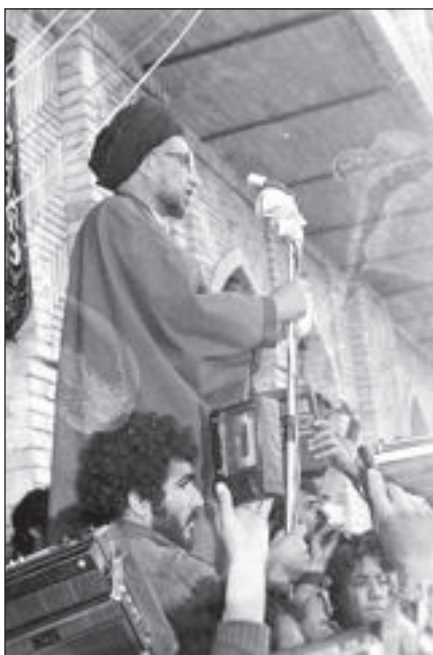
سخنرانی آیت‌الله سید حسین آیت‌اللهی در یکی از مراسم برگزار شده قبل از انقلاب

تحریک آمیزی در داخل انجام می‌گردد. شیراز را به گرفتن آقای دستغیب و جهرم و حوالی آن را به گرفتن آقای آسید حسین و تبریز را به گرفتن آقای قاضی و قم و تهران را به گرفتن جمعی از اهالی منبر و خراسان را به گرفتن آقای طبسی و کارهای دیگر و اصفهان را به نحو دیگر و سایر بلاد را هر یک به نحوی ناراحت و عصبانی می‌کنند. این مطلب حقیر را ناراحت و نگران نموده است و می‌ترسم خدای نخواستہ صحنه‌های اسفانگیزی به وجود آید که بر خلاف مصالح مملکت و اسلام است... با توجه و تعمقی که با اطراف مسائل دارید لازم است در این موضوعات فکری فرمایید. با وسیله اولیای امور متذکر فرمایید دست زدن به کارهای تحریک‌آمیز در این موقعیت و موقع خطرناک است. گرچه تذکر به دولت‌ها در این وضع بی‌نتیجه است... این مملکت را که مورد علاقه همه روحانیون است و استقلال و تمامیت ارضی آن مورد