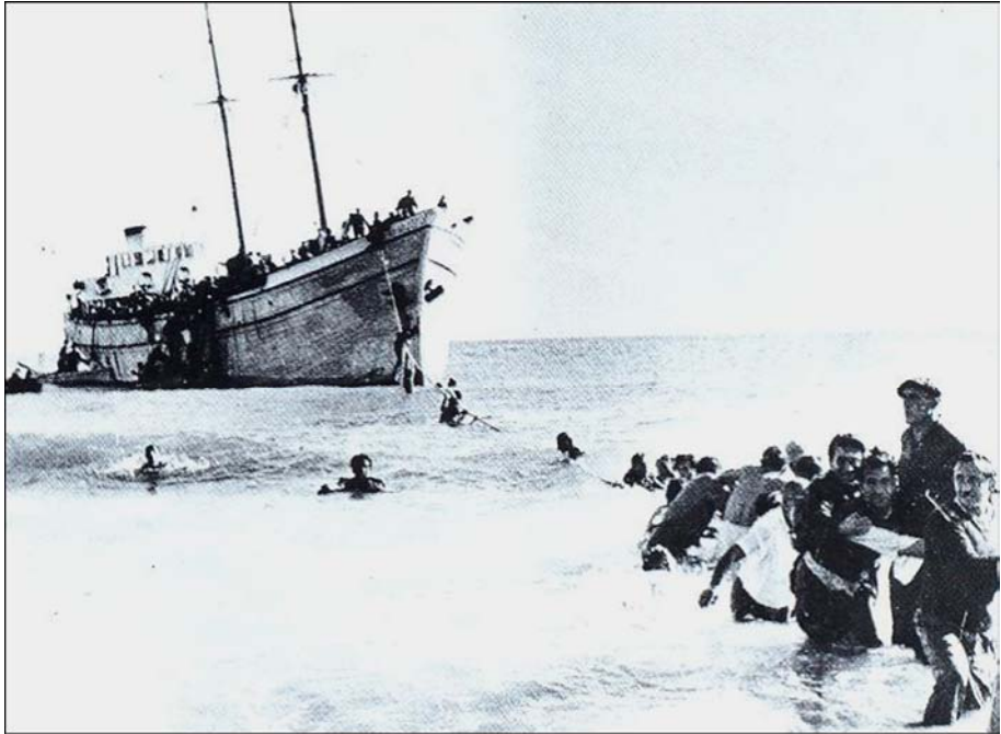
ورود غیر قانونی یهودیان به فلسطین اشغالی از طریق دریا

یهودیت در طول تاریخ حیات خود به هیچ منطقه و سرزمینی دل نبسته است الا اینکه آن سرزمین تأمین کننده منافع او باشد و با اطمینان از امنیتی کامل به منافع اقتصادی خود برسد.