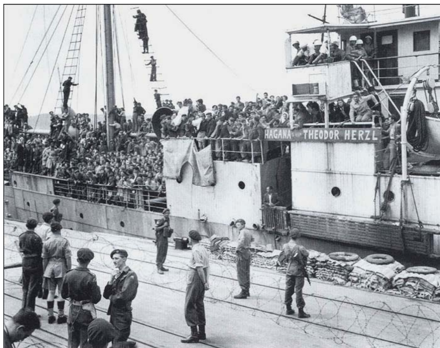
کشتی یهودیان مهاجر در انتظار صدور مجوز تخلیه توسط حکومت قیمومیت انگلیس