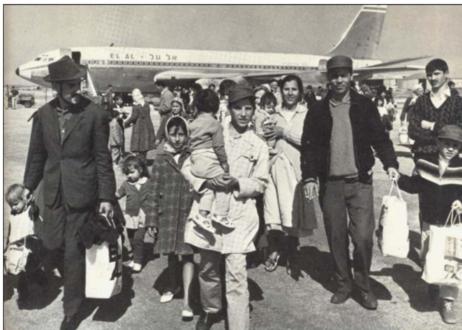
یهودیان مهاجر از مراکش هنگام پیاده شدن از هواپیما در فلسطین اشغالی

جنبش ملی یا صهیونیسم با طرح نقشه حق تاریخی بر سرزمین فلسطین و به بهانه وجود یهودستیزی ۱ در سراسر جهان، ایده بازگشت به سرزمین موعود را با سوء استفاده از برخی متون دینی و تاریخی یهود مطرح کرد و همان‌گونه که پیش‌تر از این گفته شد با تقدس مهاجرت و تبلیغ آلیا که عملی مذهبی است، مقدمات این حضور نامشروع را در منطقه فراهم نمود.