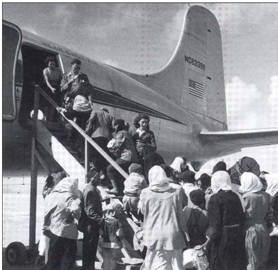
یهودیان یمن هنگام عزیمت به فلسطین اشغالی با هواپیمای امریکایی

اگر تا پیش از این صهیونیسم به داستان‌های بزرگ یهودستیزی نیاز داشت تا خود را به جهانیان بقبولاند و مهاجرت آنها را به فلسطین توجیه کند یا ترک هر سرزمینی را از منظر غیر یهودیان معقول نشان دهد در این زمان یعنی سال‌های اندک قبل از تشکیل رژیم صهیونیستی، داستانی لازم بود تا تشکیل دولت یهودی را در فلسطین برای ناظران و مردم جهان یک ضرورت اجتناب‌ناپذیر جلوه نماید.