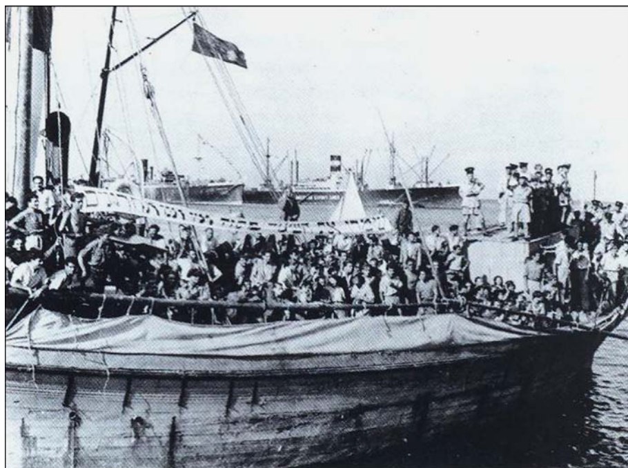
کشتی مهاجران یهودی به فلسطین اشغالی

مهاجرت عظیم و گسترده یهودیان به سرزمین فلسطین را با ذکر شماره، آلیا نامیده‌اند از جمله: آلیای اول (۱۸۸۲ - ۱۹۰۳) که در طی این دوره ۲۵۰۰۰ یهودی با تأسیس جنبش‌های عشاق صهیون ۱ و جنبش بیلو ۲ در اروپای شرقی به سمت فلسطین کوچ داده شدند. ۳ آلیای دوم (۱۹۰۴ - ۱۹۱۴) که در طی آن ۴۰۰۰۰ یهودی به فلسطین مهاجرت کردند. این موج از مهاجرت یهودیان هم‌زمان بود با تأسیس احزاب کارگری و تأسیس گروه‌هایی همچون هاشومر ۴ و آغاز فعالیت یهودیان در مزارع اشتراکی با نام کبیوتص ۵ در فلسطین اشغالی. ۶